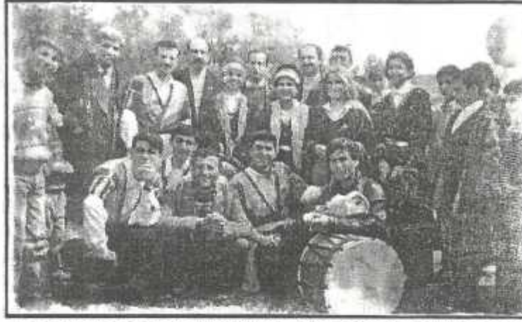
FOLKLOR GRUBU FESTİVALE AYRI BİR RENK YEREREK KATILIMCILARIN BEGENİSİNİ KAZANDI

Folklor gösterisi için İskenderun Folklor Araştırmaları Derneği ile görüşüldü. Dernek istemimizi kibarca kabul etti. 30 Mart gününde ekibini Akçalı Beldesine getirdi. Ak-der adına süslenmiş yumurta siparişi verildi. Bir kısım köylümüzle güreş yapma konusunda anlaşıldı. Afifler asılarak çevreye