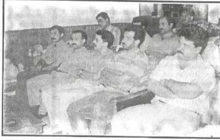
AKDER'in ARSUS TOPLANTISINDAN BİR GÖRÜNTÜ