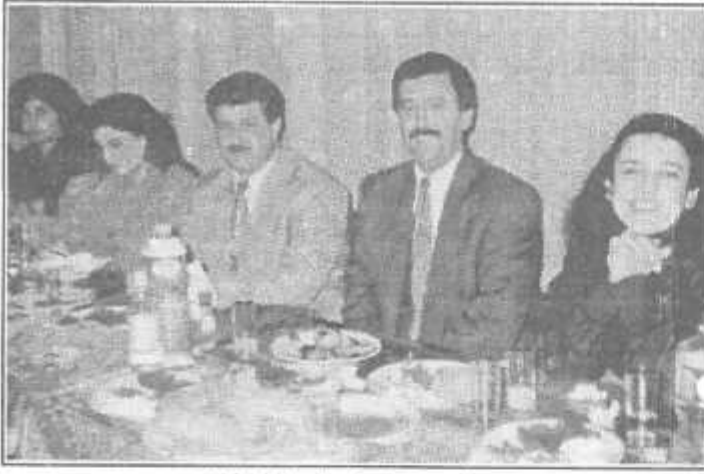
AK-DER üyeleri yemekte...