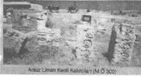
Arsuz Liman Kenti Kalıntıları (M.Ö 300)