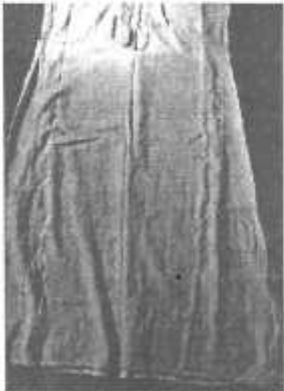
Bu el yapımı ipek kombinezon Hüyük köyü'nden bir nenenime ait. Zamanında kendi beslediği ipek böceği kozasından elde ettiği iplikleri "hayyek" (kumaş haline getiren, el tezgahında dokuyan) adı verilen kişiye verip, kumaş olarak geri almış sonra da kendine bu fotoğraftaki kombinezonu dikmiş.

"Dut ağacı yapraklarından ipek böceği besleyip, giyeceklerimizin ve çeyizimizin çoğunu ipek kumaşından hazırlardık. Fistan(elbise), mintan(gömlek), kamis (kombinezon) peşkir(havlu) ile yastık kılıflarımızı, çarşaflarımızı, nevresimlerimizi ve daha birçok giyeceğimizi saf ipek kumaşından yapardık. Baharda dut ağaçlarının yapraklanmasıyla, bir önceki bahar mevsiminden ayırdığımız tohumları