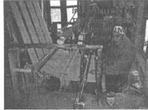
İpek iplikler el tezgahında kumaşa dönüştürülürken

Daha sonra ipleri çubuklara sarar ve bu çubukları tezgahdaki mekiğe koyarak dokumaya başlardık. Kozalar, beyaz ve altın sarısı renginde olduğundan ayrı ayrı dokurduk. Beyaz kozalardan dokuduğumuz kumaşa bazen de sarı ipliklerden desen verirdik. Dut yapraklarıyla beslediğimiz tırtılların, ördükleri kozalardan iplikleri, ipliklerden de ipek kumaşını bu şekilde elde ediyorduk."