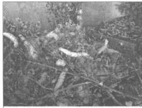
Tırtıllar kozalarını örmeye başlarken

Batı yüzyıl evvel sanayi devrimini başlatmasıyla köyleri kentleştirmiş oldu. Keşfedilen enerji güçlerinin üretim sürecine uyarlanmasıyla, fabrikalarda seri üretime geçilmiş, böylelikle dokuma ustalarımız yavaş yavaş yok olmuştur. Yöremizde, insanımızın el emeği, yaratıcılığı bu şekilde tükenmiştir.